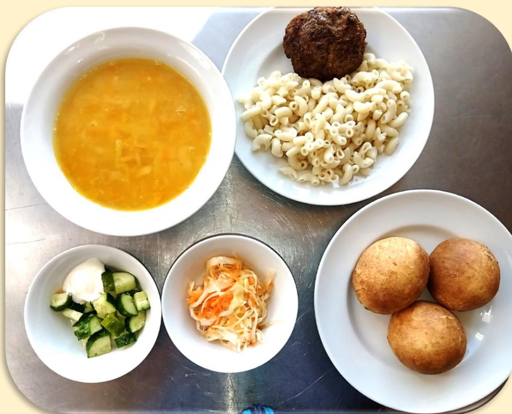
Обед. Салат «Витаминный». Салат из свежих огурцов со сметаной. Суп картофельный с горохом. Биточек «Богатырь». Макароны отварные. Хлеб ржаной, хлеб пшеничный. Кисель. Булочка «Витьба»