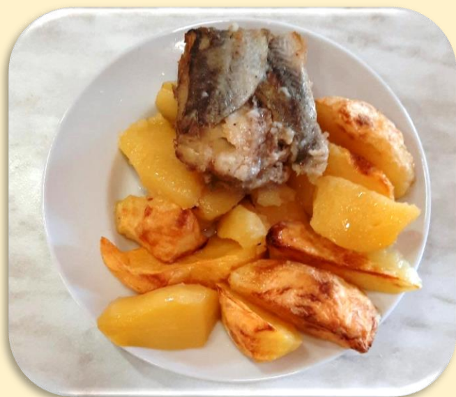
Картофель запеченный «Антошкина картошка». Рыба жареная