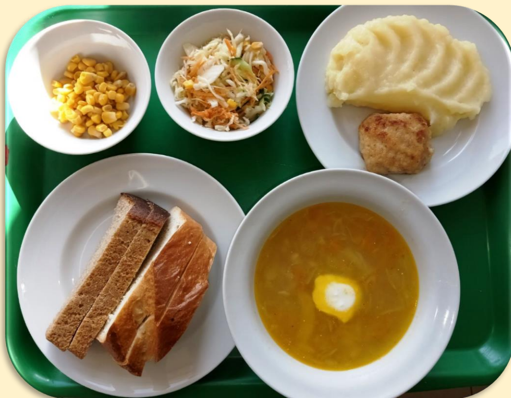
Обед. Салат «Светофорчик». Суп «Крестьянский». Медальоны из птицы. Пюре картофельное. Кукуруза консервированная (порционно) Хлеб ржаной, хлеб пшеничный. Компот.