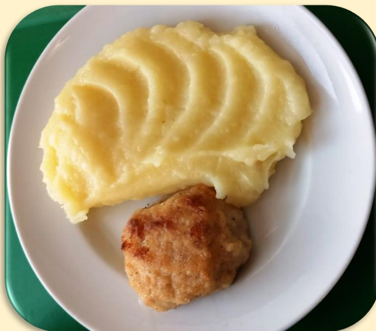
Зразы из свинины с сыром. Пюре картофельное.